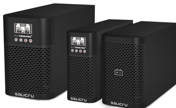
SLC TWIN PRO2